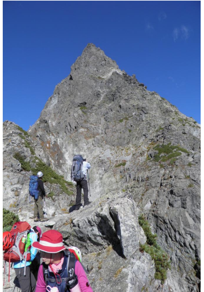
▲ 稜線からの槍ヶ岳